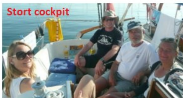
Som man kan se: Plads til endnu to kønne piger.

Nævnes skal også, at cockpittet er længere, agterlugen er sløjfet, og bredere, - da cockpittet går helt ud i borde.